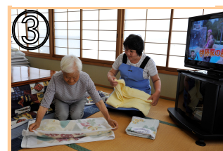
③ 一緒に洗濯物をたたむ