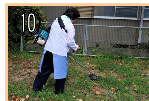
⑩ 草刈りや庭の草抜き