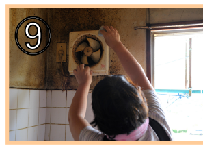
⑨ 換気扇を取り外すなどの大掃除