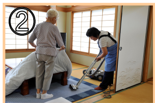
② 一緒に掃除をする