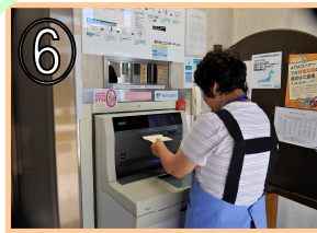
⑥ 金融機関でのお金の取扱い及び支払い等