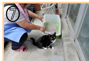
⑦ ペットの買い物及び世話