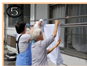
⑤ 一緒に洗濯物を干す