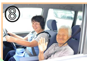
⑧ 社協ヘルパーの車への同乗